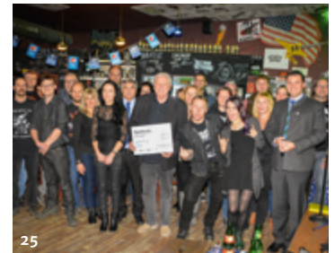
ABB. 25 Musikfans engagieren sich für Opfer.